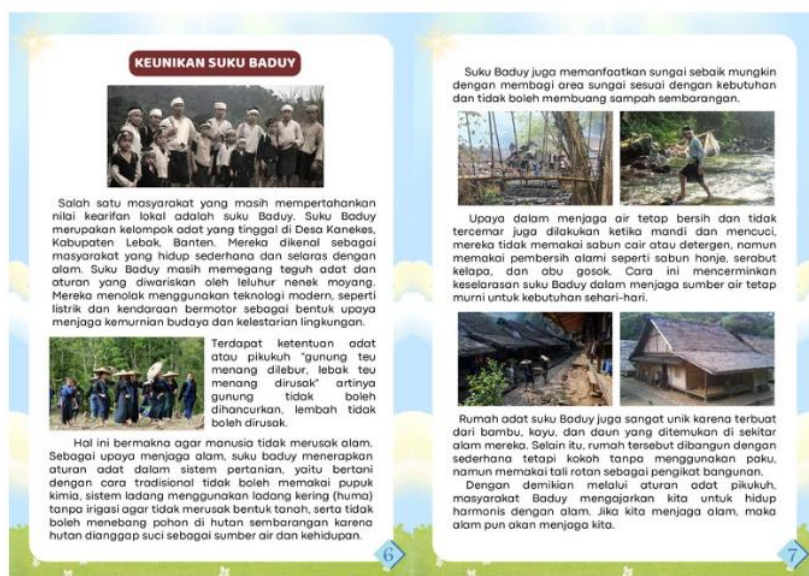
Gambar 3. Isi Konten Bahan Ajar

Rancangan isi bahan ajar terdiri dari halaman sampul, kata pengantar, daftar isi, panduan penggunaan, capaian pembelajaran, tujuan pembelajaran, isi materi pembelajaran, soal evaluasi kelompok dan individu, glosarium, dan daftar pustaka. Materi pembelajaran bersumber dari beberapa artikel dan buku yang membahas kehidupan, nilai-nilai, dan kearifan lokal yang dijunjung oleh masyarakat Baduy, serta gambar yang disajikan bersumber dari internet.