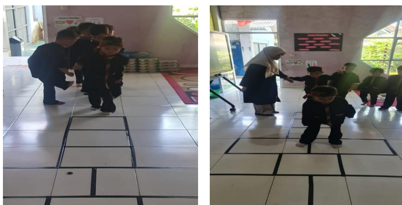
Gambar 3. Guru mempraktekan permainan tradisional engklek

Hasil observasi di TK ABA 1 Kota Sukabumi menunjukkan keterlibatan siswa yang antusias dalam kegiatan-kegiatan ini. Siswa-siswa ini telah mengembangkan keterampilan sosial, termasuk kolaborasi, pemecahan masalah, dan kepatuhan terhadap aturan permainan. Pernyataan guru selama wawancara menguatkan gagasan ini, menunjukkan bahwa partisipasi dalam kegiatan permainan engklek tradisional telah memfasilitasi munculnya keterampilan sosial. Melalui interaksi sosial, siswa telah menunjukkan kemampuan untuk memahami emosi mereka sendiri dan emosi orang lain. Dalam permainan tradisional engklek ini, beberapa siswa sudah dapat memengaruhi teman-temannya dengan mengingatkan peserta lain bahwa tindakan mereka tidak sejalan dengan apa yang diajarkan oleh guru. Lebih lanjut, siswa menunjukkan perilaku kolaboratif dan kooperatif, yang penting untuk pengembangan keterampilan sosial mereka. Siswa di TK ABA 1 Kota Sukabumi menunjukkan kemampuan ini saat bermain permainan engklek , sebagaimana dibuktikan oleh pemahaman mereka terhadap aturan permainan dan kapasitas mereka untuk berkolaborasi secara mandiri tanpa bimbingan guru.