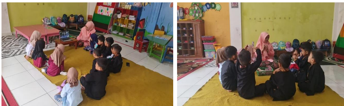
Gambar 1. Guru mengenalkan permainan tradisional engklek

Berdasarkan hasil wawancara dengan guru setelah selesai kegiatan pembelajaran permainan tradisional engklek menyatakan bahwa " permainan tradisional engklek dapat meningkatkan dan memupuk perkembangan keterampilan sosial anak, karena permainan engklek memungkinkan untuk mendorong kerja sama, komunikasi, giliran bermain, regulasi sosial (aturan permainan) dan resolusi konflik. " Berdasarkan observasi Engklek mendorong partisipasi aktif anak dalam permainan, sehingga meningkatkan kemampuan fisik, sosial, dan kognitif mereka. Anak-anak diajarkan untuk menumbuhkan pemahaman tentang adat istiadat setempat, memahami peraturan permainan, berkolaborasi, dan mematuhi arahan guru.