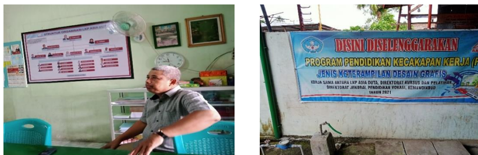
Gambar 3. Dokumentasi Wawancara dengan Kepala Kurus SDM Lembaga Duta Asia

Hasil wawancara dengan LPK Duta Asia Kecamatan Wonomulyo disebutkan bahwa pihaknya setiap tahun mendapatkan bantuan beasiswa bagi mahasiswa kurang mampu, agar mereka dapat mengikuti pelatihan di Asian Ambassador Course Institute guna memperoleh keahlian khusus yang akan digunakan sebagai bekal membuka usaha di Kabupaten Polewali Mandar. Terkait kerjasama dengan Dinas Pendidikan, lembaga kursus harus melapor ke Dinas Pendidikan Kabupaten Polewali Mandar bahwa mereka telah menerima dana bantuan pendidikan dari Dinas Pendidikan Pusat dan akan digunakan untuk membina siswa yang kurang mampu. Keterlibatan lembaga kursus duta Asia ini, tentunya sumber daya manusia yang ada di Kabupaten Polewali Mandar kedepannya akan mengurangi pengangguran, dan akan meningkatkan kemampuan sumber daya manusia untuk membuka usaha sendiri. Selain lembaga kursus, Dinas Pendidikan setempat berperan penting dalam meningkatkan keterampilan sumber daya manusia, oleh karena itu berikut akan dibahas kerjasama dengan Dinas Pariwisata Kabupaten Polewali Mandar.