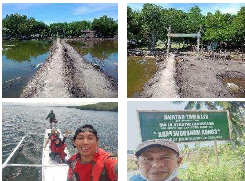
Gambar 2. Dokumentasi Wisata Pantai Gonda

Berdasarkan hasil observasi di lokasi penelitian pantai Gonda sebagai salah satu objek wisata unggulan di Kabupaten Polewali Mandar dan sebagai lokasi yang akan dijadikan studi kasus. Objek wisata ini masih sangat perlu mendapat dukungan dari pihak-pihak yang berkepentingan, guna memberikan kenyamanan bagi para pengunjungnya. Pengelolaan dilakukan secara profesional sehingga menghasilkan pendapatan bagi pengembangan daya tarik wisata yang berkelanjutan, sehingga masyarakat sekitar dapat merasakan pentingnya kegiatan usaha pariwisata. Pantai Gonda juga telah mendapatkan pengakuan dari pemerintah bahwa desa Gonda merupakan Desa Wisata, dengan pengakuan tersebut desa ini sudah memiliki potensi yang sangat mendukung dalam pengembangannya. Objek wisata pantai Gonda terlihat pada gambar 2 berikut.