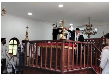
Gambar 4. Proses Ibadah Kaum Yudaisme di Sinagoge Shaar Hashamayim Tondano

Cara pandang kaum Yudaisme dalam diskusi atau bermusyawarah berdasarkan benang merah permasalahan, prinsip kehati-hatian, konsistensi dalam memahami. Setiap keputusan yang disepakati bersama baik itu dalam organisasi keagamaan maupun dimasyarakat sesuai dengan aturan yang berlaku di tempat dia tinggal. Dalam hal ini, mereka mematuhi dan menyelaraskan ajaran agamanya serta mengaplikasikannya dalam kehidupan sehari-hari dengan mengindahkan aturan-aturan atau norma yang berlaku di masyarakat. Mereka juga aktif dan berkontribusi nyata dalam kegiatan bermasyarakat contohnya baik itu dalam aktivitas di lingkungan sekitar, pekerjaan, maupun kegiatan dalam tatanan masyarakat. Keutuhan mereka saat ini memperlihatkan bahwa kebudayaan, norma dan adat istiadat yang diajarkan dalam ajaran Yahudi diterapkan dengan baik. Sebagai kelompok yang kecil, kebersamaan dalam menjaga keutuhan diutamakan. Kaum Yahudi bersikap mengadaptasi lingkungan sekitar dan masyarakat yang dipadukan dengan ajarannya yang diajarkan dalam setiap ibadah bersama pada hari Sabat (Gambar 4).