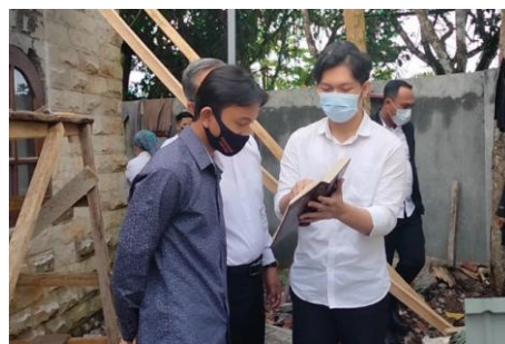
Gambar 2. Interaksi antar individu dalam kelompok dalam proses belajar/Halaqah (Sumber: Dokumentasi Penelitian, 2021)

ajaran untuk satu bangsa, satu suku saja. Ajaran Yahudi tidak untuk disebarikan ke bangsa atau suku lain. Mereka memaparkan bahwa ajaran Yahudi hanya untuk keturunan Bani Israel. Esesnsi ajaran Yahudi terletak pada apa yang disebut The Ten Commandments atau Decalogue (Sepuluh Perintah Tuhan) yang didalamnya mengandung aspek aqidah, ibadah, syari'ah, hukum dan lainnya. Tradisi ajaran Yahudi berasal dari proses sejarah yang panjang, melalui lisan para Nabi dan Rabi mereka dengan konsep ketuhanan dan moral yang terus menerus diwariskan dan dimatangkan. Dari segi etika, kaum Yudaisme memiliki dua sumber literature utama yaitu Tanakh dan Literatur para Rabi. Yudaisme sebagai agama tradisi tidak hanya memiliki sumber tertulis sebagai ajaran dan pedoman hidup. Sumber lain dari tulisan para Rabi yaitu Mishna, Midrasy, Talmud dan Targum. Inilah yang menjadi ajaran dan arah bagi kaum Yudaisme dalam menjalankan aktivitasnya sehari-hari (Gambar 1). Interaksi sosial diantara para jemaat Sinagoge Shaar Hashamayim Tondano terbilang hangat dan tidak ada perselisihan sama sekali. Implementasinya di masyarakat, kaum Yudaisme memiliki interaksi yang cakap dan diterima dengan baik dalam tatanan sosial di lingkungannya. Tidak hanya itu, beberapa organisasi umat Yahudi lain selalu melakukan pertemuan untuk studi banding tentang keilmuan ajaran-ajaran agama Yahudi yang terdapat di Sinagoge Shaar Hashamayim Tondano.