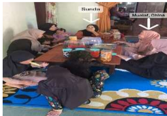
Gambar 6. Indahnja Lebaran

Pelaksanaan Lebaran umumnya mencerminkan harmoni budaya dan adat istiadat dari masing-masing etnis. Meski setiap etnis memiliki tradisi dan tata cara yang berbeda dalam merayakan Lebaran, masyarakat di Desa Sempurna tidak mempunyai aturan khusus dalam pelaksanaan Lebaran. Setiap orang tanpa melihat latar belakang sosialnya dapat ikut serta. Setiap orang baik tua maupun muda, Islam maupun non-Islam, satu etnis maupun beda etnis dapat turut serta merayakan Lebaran. Pada gambar dibawah ini misalnya ada salah satu momen perayaan Lebaran disalah satu rumah orang Melayu dimana yang berkunjung berasal dari Etnis Sunda bahkan ada juga seorang Mualaf China