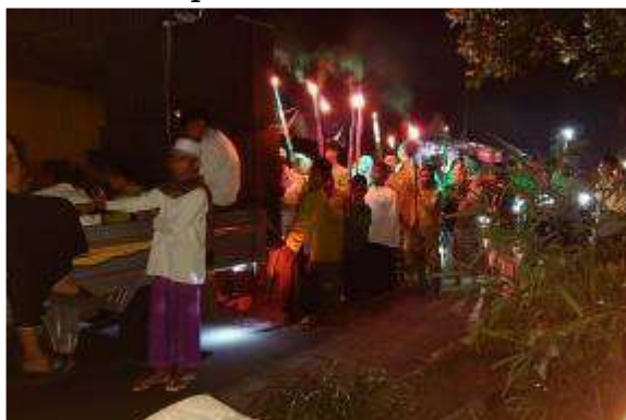
Gambar 4. Pawai Obor

Pawai Obor adalah tradisi yang selalu dilakukan oleh masyarakat di Desa Sempurna Kecamatan Subah dalam merayakan datangnya bulan suci ramadhan. Pawai obor adalah bentuk kegembiraan dan kesiapan masyarakat untuk berpuasa selama sebulan penuh selama bulan Suci Ramadhan. Sesuai dengan namanya ciri yang khas dengan tradisi Pawai Obor yaitu para peserta pawai membawa obor, memakai baju muslim, peci, dan sarung. Berikut ini adalah gambar kemeriahan kegiatan Pawai Obor di Desa Sempurna: