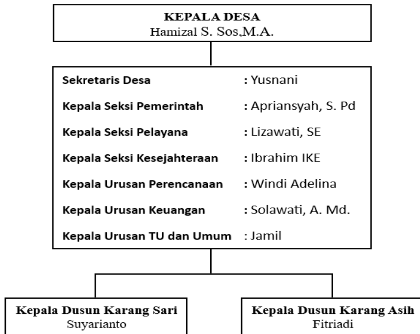
Tabel 2. Struktur Kepengurusan Desa Sempurna

Dalam perayaan hari raya idul fitri biasanya terdapat tradisi atau budaya yang kerap dilakukan oleh masyarakat etnis yang berbeda beda terutama etnis Jawa dan Melayu, untuk etnis Sasak, dan Thiongoa hanya ikut alur dan ikut berkontribusi dalam budaya tersebut, karena etnis Sunda, etnis Sasak dan Thiongoa jumlah mayarakatnya minim. Tradisi yang seriang dilakukan diantaranya: