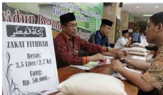
Gambar 4. Zakat Fitrah

diri dan jiwa dari dosa dan kesalahan, Meringankan beban keuangan orang yang membutuhkan, kebersamaan di antara umat Muslim, Menjadi sarana syukur atas nikmat Ramadan. Berikut ini adalah gambar kegiatan membayar zakat Fitrah di Desa Sempurna: