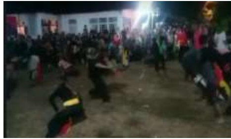
Gambar 3. Tradisi Kuda Lumping/Jajaran