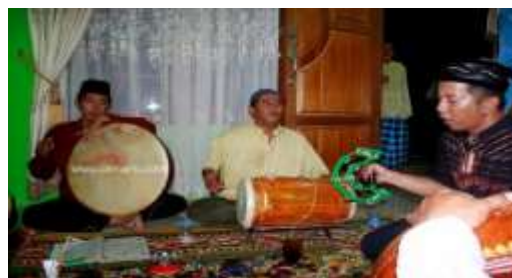
Gambar 4. Tradisi Syair atau Lantunan Sholawat

Penggabungan antara syair dan nada Melayu memberikan sentuhan unik dan khas pada tradisi keagamaan etnis Melayu di daerah desa Sempurna. Tradisi ini bukan hanya etnis Melayu saja melainkan etnis etnis lain juga ikut berkontribusi dalam penyairan Sholawat lantunan ayat suci Al-Qur'an, tapi sebagian besar etnis Melayu. Kedua tradisi ini mencerminkan keragaman budaya tapi juga menjadi sarana untuk memperkuat identitas dan ikatan sosial masyarakat setempat. Berikut ini adalah gambar kegiatan Syair atau Lantunan Sholawat: