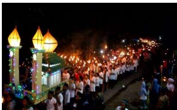
Gambar 5. Malam Takbiran

Malam takbir menjelang Idul Fitri adalah malam yang dirayakan oleh umat Muslim di seluruh dunia begitupun di Desa Sempurna. Pada malam ini semua warga Desa Sempurna tanpa melihat lebar belakang etnisnya turut ambil bagian untuk merayakan kegiatan Takbir Keliling. Kegiatan Takbir Keliling yang ada di Desa Sempurna berjalan dengan samangat meriah. Kemeriahan tersebut terlihat dengan Kumandang Takbir , Tahmid , dan Tahlil yang dilantunkan silih berganti oleh peserta Takbiran. Selain itu, kemeriahan tersebut juga dimeriahkan oleh kegiatan pawai Takbiran Keliling. Peserta Takbir Keliling ternyata membawa obor, memakai baju koko, memakai sarung, peci dan jilbab bagi para perempuan, menghidupkan mercon maupun kembang api, bahkan membuat miniatur masjid yang ditandu keliling kampung seperti yang terlihat dari gambar berikut: