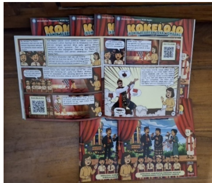
Gambar 1. Media KOKELOJO (Komik Kearifan Lokal Jombang)

Pengembangan media KOKELOJO (Komik Kearifan Lokal Jombang) terbukti efektif dalam meningkatkan hasil belajar peserta didik, khususnya dalam memperkuat kemampuan siswa dalam mengidentifikasi nilai-nilai kearifan lokal di lingkungan tempat tinggal. Media ini diintegrasikan ke dalam pembelajaran Pendidikan Pancasila pada elemen NKRI fase B kelas IV SD di Kabupaten Jombang. Media KOKELOJO (Komik Kearifan Lokal Jombang) mengangkat cerita dan karakter khas kesenian Ludruk Jombang, yang dikemas secara visual menarik dengan narasi sederhana dan kontekstual, sehingga memudahkan siswa memahami keterkaitan antara budaya lokal dan nilai-nilai kebangsaan. Tidak hanya berfungsi sebagai penyampai informasi, media ini juga mendorong pembelajaran yang bermakna dengan mengaktifkan siswa dalam proses membangun pemahaman tentang identitas lokal.