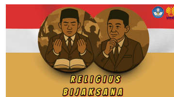
Gambar 21. Isi videoclip ketiga setelah direvisi