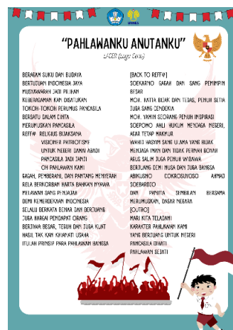
Gambar 13. Lirik lagu ketiga setelah direvisi