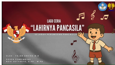
Gambar 5. Cover Videoclip lagu pertama