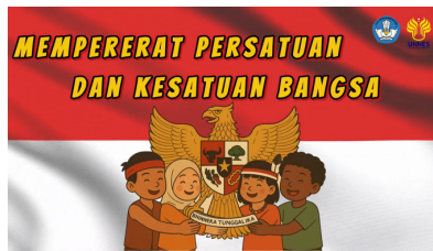
Gambar 9. Isi Videoclip kedua