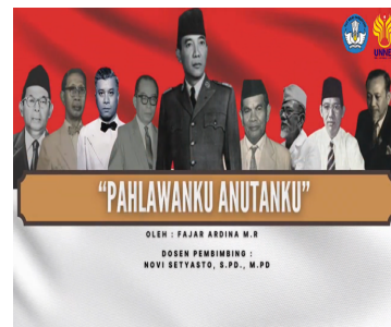
Gambar 15. Cover videoclip ketiga setelah direvisi