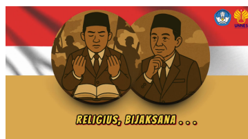
Gambar 20. Isi videoclip ketiga sebelum direvisi