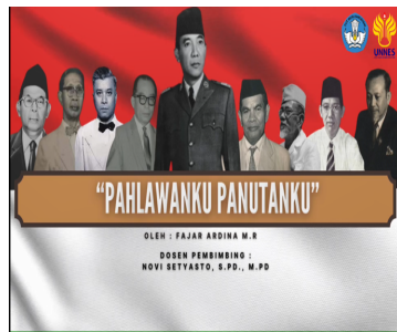
Gambar 14. Cover videoclip ketiga sebelum direvisi