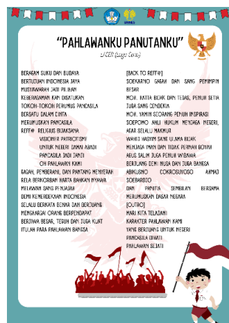
Gambar 12. Lirik lagu ketiga sebelum direvisi

Pada tahap ini, peneliti mendapatkan masukan dan saran dari validator ahli materi, bahasa, dan media. Pada saat validasi materi, validator ahli materi memberikan sedikit saran agar melengkapi perangkat pembelajaran dengan adanya lirik lagu ceria yang akan digunakan. Kemudian validator ahli bahasa memberikan masukan bahwa adanya revisi pada judul lagu ketiga yang awalnya berjudul “Pahlawanku Panutanku” menjadi “Pahlawanku Anutanku” karena kata “panutan” tidak ada didalam KBBI, juga terdapat beberapa revisi mengenai tanda baca yang digunakan. Sedangkan untuk validator media tidak memberikan saran dan masukan dikarenakan media sudah bagus dengan kombinasi teks, gambar, dan audio pada videoclip lagu ceria.