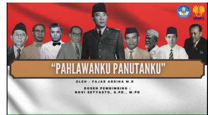
Gambar 7. Cover Videoclip lagu ketiga