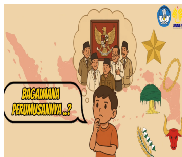
Gambar 16. Isi videoclip pertama sebelum direvisi