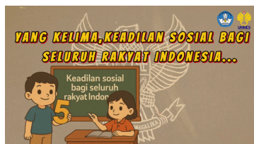
Gambar 18. Isi videoclip kedua sebelum direvisi