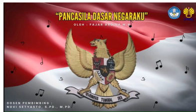
Gambar 6. Cover Videoclip lagu kedua