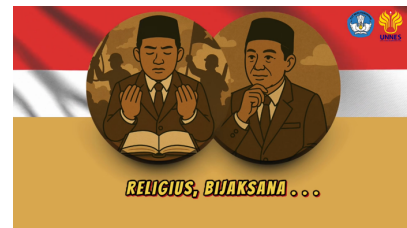
Gambar 10. Isi Videoclip ketiga