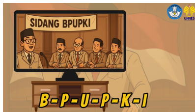
Gambar 8. Isi Videoclip pertama