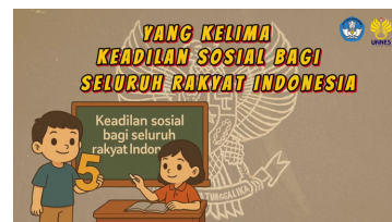
Gambar 19. Isi videoclip kedua sebelum direvisi