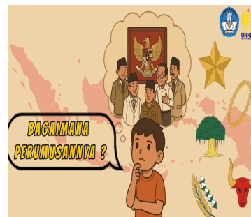
Gambar 17. Isi videoclip pertama sebelum direvisi