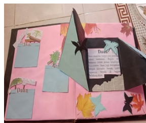
Gambar 4 materi daun dan game