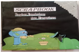
Gambar 1 cover dengan menggunakan canva