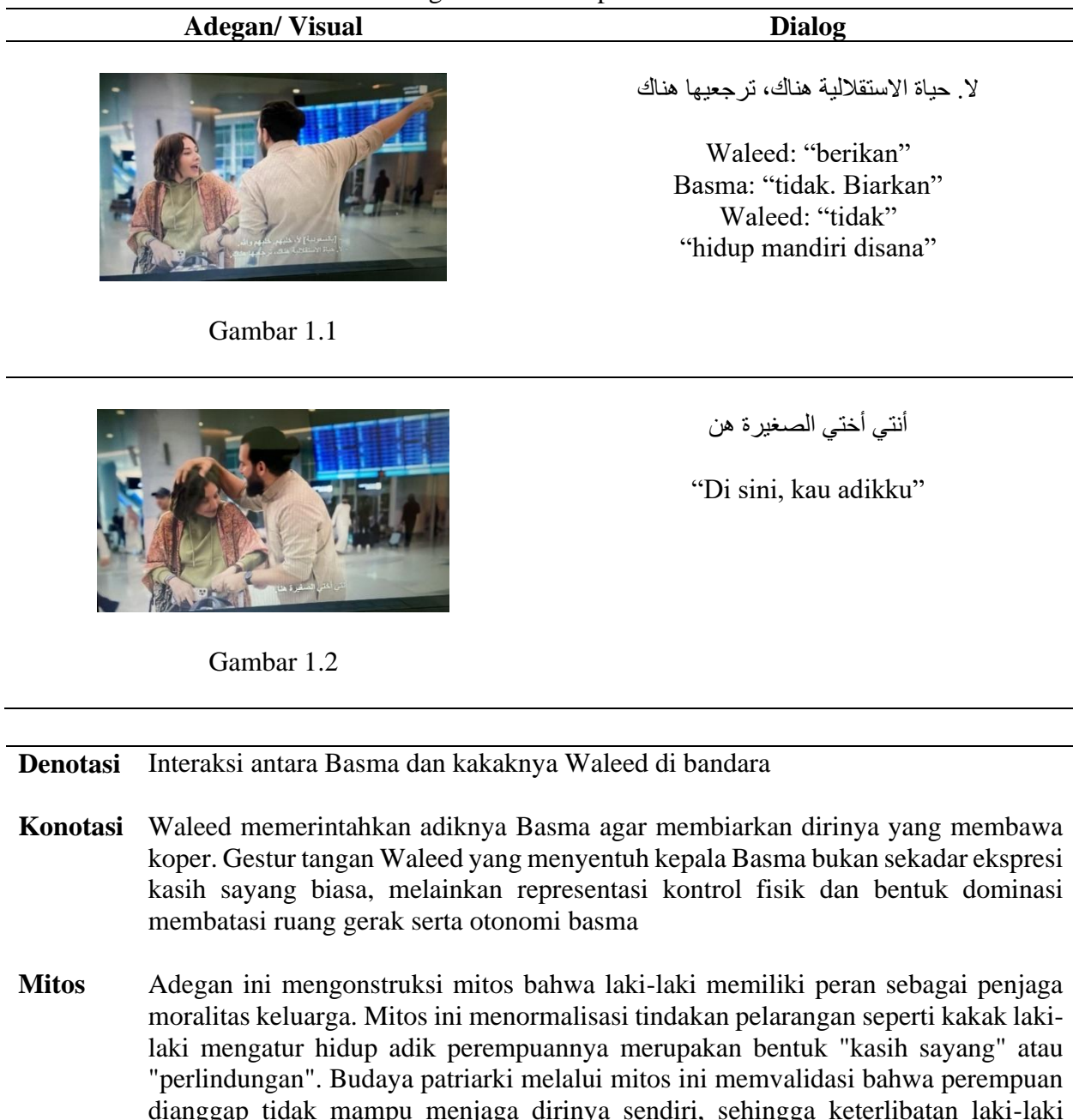
Table 1. Adegan di bandara pada menit ke 01: 51

Cuplikan adegan berikut menggambarkan adanya bentuk budaya patriarki privat atau domestik dalam bentuk pembatasan mobilitas dan otonomi perempuan. Dimana perempuan tidak bisa sepenuhnya hidup mandiri tetapi harus dalam kontrol laki-laki di dalam keluarga. Waleed secara langsung mengontrol Basma dalam larangan "hidup mandiri di sana" dan "disini kau adikku" adalah upaya untuk memastikan Basma tetap berada dalam kontrol Waleed di dalam struktur keluarga.