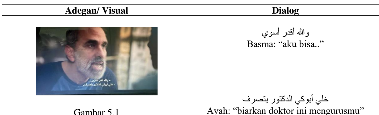
Tabel 5. Adegan di rumah sang ayah pada menit ke 46: 06

Cuplikan adegan berikut menggambarkan adanya bentuk budaya patriarki privat dalam bentuk subordinasi terhadap anak perempuannya. Melalui penegasan gelar "Doktor" ayah melancarkan subordinasi intelektual terhadap Basma. Tindakan ini berfungsi sebagai mekanisme pertahanan narsistik guna mempertahankan hierarki kekuasaan dengan mendelegitimasi ucapan "Aku bisa" Basma, ayah berhasil memposisikan perempuan tersebut kembali sebagai subjek pasif yang bergantung. Secara semiotis, gelar profesi tersebut dimanfaatkan sebagai alat untuk menaturalisasi dominasi laki-laki atas kemandirian perempuan.