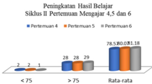
Gambar 2 Grafik Ketuntasan Hasil Belajar Siklus II

Sedangkan grafik ketuntasan rata-rata pertemuan 4, 5 dan 6 siklus II sebagai berikut.