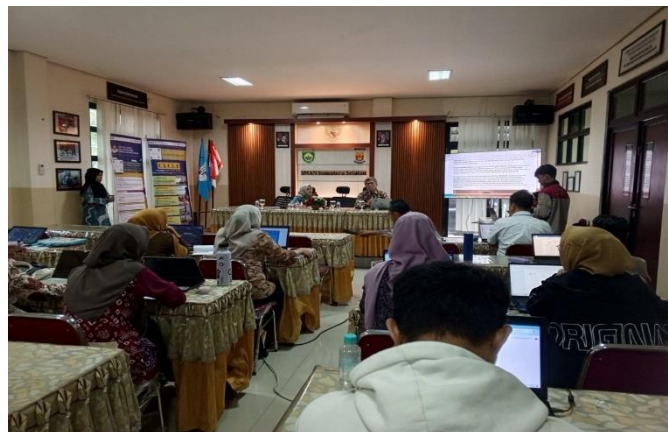
Gambar 3. Pelatihan dan Pendampingan Penyusunan Kasus Bullying Multikultural

Pada hari kedua, narasumber mengevaluasi tugas yang dikerjakan peserta. Selanjutnya, memberi pelatihan menyusun kasus yang benar menggunakan metode 3C3R. Peserta sangat antusias mengikuti pelatihan. Peserta diberi kesempatan untuk menyusun kasus sendiri dan didampingi oleh tim pengabdian. Pendampingan dilakukan dengan baik oleh dosen dan mahasiswa. Setelah penyusunan kasus selesai, salah satu peserta diminta mempraktikkan layanan dasar berbasis kasus menggunakan kasus yang telah dibuat. Kemudian dievaluasi oleh narasumber yaitu Dr. Yosef, M.A. Kegiatan pelatihan dan pendampingan dapat dilihat pada Gambar 3 berikut.