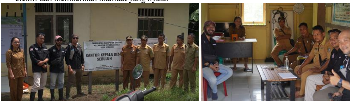
Gambar 3. Koordinasi Eksternal Dengan Tokoh Desa

Koordinasi dengan pihak luar antara lain dengan Kepala Desa dan ketua kelompok tani Lada Sebuluh, serta beberapa anggota kelompok tani. Koordinasi dengan tokoh-tokoh desa melibatkan seluruh anggota tim pelaksana kegiatan pengabdian agar program tersebut dapat berjalan dengan efektif dan memberikan manfaat yang nyata.