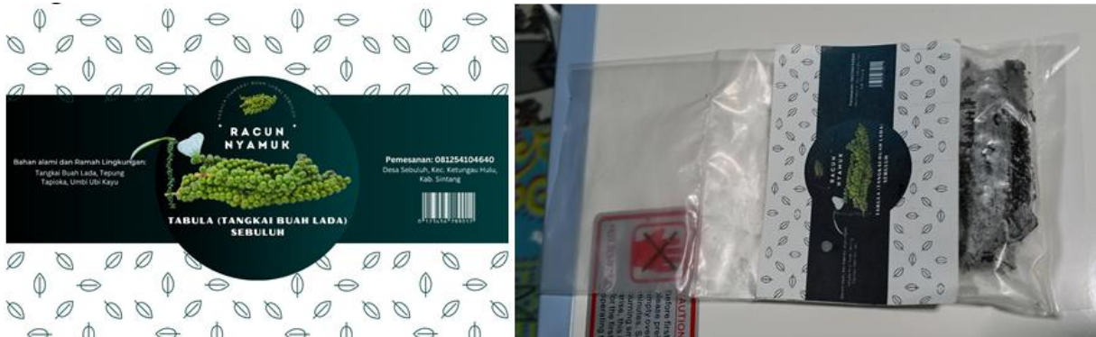
Gambar 5. Desain Logo Produk dan Kemasan Produk

diambil pucuk daunnya dan dimanfaatkan sebagai sayuran. Pemanfaatan batang sekaligus umbinya sebagai bahan pengisi, pembuat arang dan pengikat dalam pembuatan racun nyamuk bakar secara tidak langsung menerapkan prinsip zero waste , selain pemanfaatan tangkai buah lada sebagai bahan utama. Sosialisasi lain adalah pemaparan tentang pentingnya branding dan packaging dalam memasarkan sebuah produk. Hasil racun nyamuk bakar yang dipraktikkan dapat dikemas dengan baik dan dilakukan branding untuk meningkatkan umur produk dan menarik pembeli. Dalam sosialisai ini juga akan didiskusikan branding yang disepakati oleh kelompok tani yaitu “TABULA (Tangkai Buah Lada) SEBULUH yang cukup menggambarkan identitas produk. Dibuat pula logo beserta keterangan yang ada pada label yang akan ditempatkan pada kemasan produk. Disampaikan pula cara packaging yang baik untuk menjaga kualitas produk racun nyamuk bakar menggunakan plastik transparan yang nantinya akan disealing dengan alat sealer .