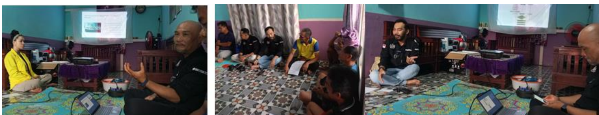
Gambar 4. Sosialisasi Bahaya Nyamuk serta Peluang Produksi Racun Nyamuk Bakar dari Limbah Tangkai Buah Lada, Sosialisasi Pentingnya Branding dan Packaging , Serta Sosialisasi Cara Pembuatan Produk

Proses sosialisasi awal dilakukan langsung di desa Sebuluh bersama anggota kelompok tani Lada sebuluh. Sosialisasi dilaksanakan di rumah ketua kelompok tani, dengan pertimbangan keberadaan aliran listrik di rumah tersebut, sehingga proses sosialisasi dilaksanakan malam hari tanpa perlu mengganggu aktivitas warga yang semuanya bekerja di kebun pada pagi hingga sore hari. Sosialisasi dilakukan untuk memperkenalkan program pengabdian yang dilakukan oleh tim dosen Universitas Kapuas yang didanai oleh Kementerian Pendidikan Tinggi, Sains dan Teknologi Republik Indonesia. Hal ini disampaikan agar terbangun kesadaran bahwa negara peduli dengan petani kecil apalagi kondisi geografis desa Sebuluh berada di daerah perbatasan Indonesia-Malaysia sehingga penyampaian ini dianggap penting untuk dapat menumbuhkan rasa nasionalisme masyarakat perbatasan. Sosialisasi juga berguna untuk membangun komitmen bersama dalam pelaksanaan maupun keberlanjutan program pengabdian.