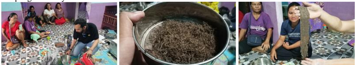
Gambar 6. Pelatihan Pembuatan produk

Pelaksanaan pelatihan dimulai dengan pengenalan dan informasi cara pengoperasian setiap peralatan yang digunakan baik dalam pembuatan produk racun nyamuk bakar maupun dalam desain branding dan cara packaging yang baik. Proses pembuatan produk dimulai dari tahapan persiapan alat dan bahan, penghalusan bahan utama limbah tangkai buah lada, bahan pengisi/penghasil bara yaitu batang singkong serta bahan pengikat yaitu umbi singkong. Terhadap umbi singkong yang telah selesai dihaluskan kemudian direndam dalam air dan kemudian disaring dengan kain, hasil saringan kemudian dibiarkan hingga mengendap dan kemudian dikeringkan dengan oven pengering untuk mendapatkan tepung tapioka. Langkah berikutnya adalah mengukur komposisi dan mencampur ketiga bahan dengan alat pengaduk mekanik/ mixer dengan takaran yaitu bahan utama 25%, perekat 60% dan pengisi/penghasil bara 15%. Adonan hasil pencampuran kemudian dipipihkan dan dicetak dengan alat pencetak mekanik. Langkah berikutnya adalah pengeringan produk yang telah dicetak kemudian dilakukan uji pembakaran singkat. Langkah terakhir yaitu peserta diajarkan cara menyegel produk dalam kemasan plastik dengan alat sealer . Selanjutnya anggota kelompok tani Lada Sebuluh yang hadir juga diberikan kesempatan untuk melakukan duplikasi setiap langkah pembuatan produk serta cara pengemasannya.