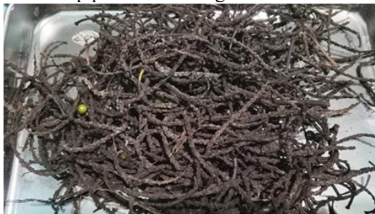
Gambar 1. Limbah tangkai Buah Lada ( ruman )

dipisahkan dari tangkainya sehingga diperoleh buah lada yang siap jual. Terkait rangkaian proses pengolahan tersebut terdapat limbah produksi berupa tangkai buah lada. Masyarakat Desa Sebuluh menyebut tangkai buah lada tersebut sebagai “ ruman ” yang hanya ditumpuk dan dibiarkan membusuk. Dari setiap rumah tangga yang memiliki kebun dengan jumlah tanaman lada mendekati 300 batang, tersisa sekitar 3 kilogram tangkai buah lada yang selama ini tidak dimanfaatkan oleh masyarakat karena ketidaktahuan mereka terhadap potensi kandungan kimia didalamnya.