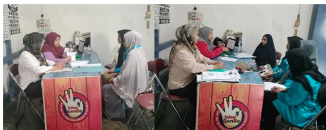
Gambar 1. Koordinasi Tim Pelaksana Bersama Pendamping Sosial PKH dan Koordinator PKH Kota Singkawang

Kegiatan ini diawali dengan koordinasi antara tim pelaksana dan pendamping Program Keluarga Harapan (PKH) untuk mengidentifikasi mengenai kebutuhan, potensi, serta tantangan yang dihadapi oleh keluarga penerima manfaat (KPM) dalam mendampingi pendidikan anak-anak mereka. Berikut gambar kegiatan koordinasi tersebut.