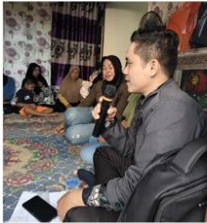
Gambar 6. Simulasi Teknis Cara Daftar dan Akses Informasi KIP Kuliah