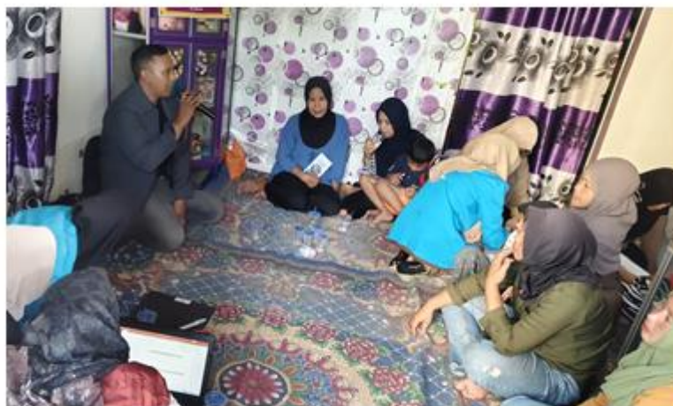
Gambar 8. Diskusi Terbuka antara Peserta dan Narasumber