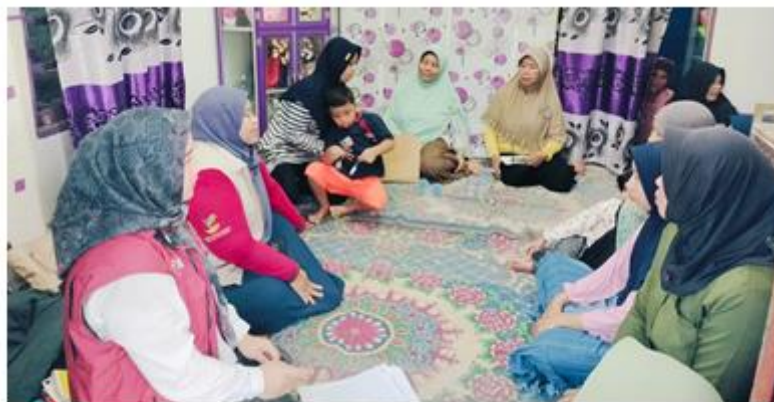
Gambar 10. Pendamping PKH Berinteraksi dengan Peserta

Untuk mengukur efektivitas kegiatan, dilakukan pre-test dan post-test terhadap pemahaman peserta mengenai program KIP Kuliah. Sebelum dan sesudah kegiatan, peserta diminta mengisi kuesioner untuk menilai tingkat pemahaman dan respons mereka terhadap informasi yang disampaikan. Sebelum kegiatan dimulai, dari 27 hanya 11 responden (40,7%) yang mengaku mengetahui tentang program KIP Kuliah, sedangkan 16 responden (59,3%) belum pernah mendengar informasi tersebut. Hal ini menunjukkan rendahnya literasi awal peserta mengenai program beasiswa pendidikan tinggi dari pemerintah.