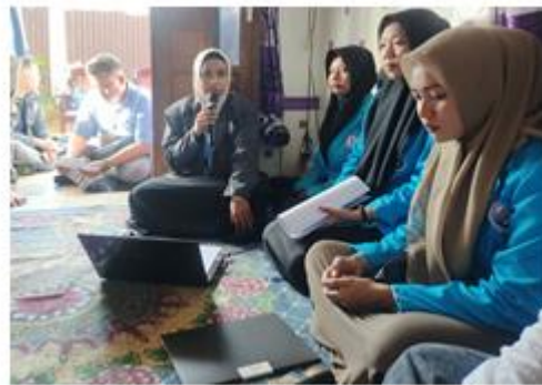
Gambar 4. Penyampaian Materi Sesi 1 Peran Orang Tua Terhadap Pentingnya Pendidikan Tinggi