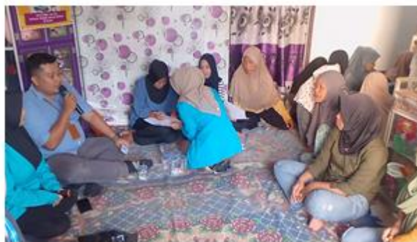
Gambar 5. Penyampaian Materi Sesi 2 Informasi KIP Kuliah (Syarat, Prosedur, dan Manfaat)