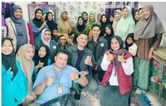
Gambar 2. Pelaksanaan Kegiatan di Lokasi