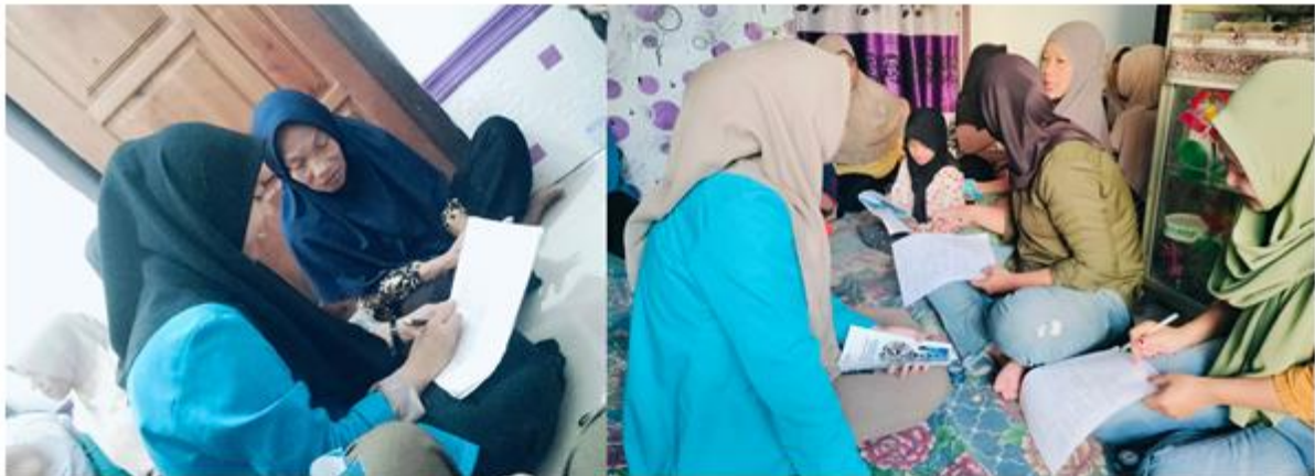
Gambar 9. Evaluasi Melalui Pre-test dan Post-test