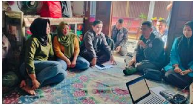
Gambar 3. Pembukaan Kegiatan Sosialisasi