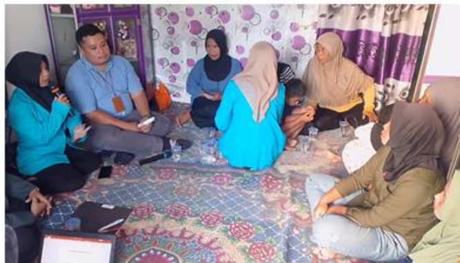
Gambar 7. Testimoni Mahasiswa Penerima KIP Kuliah