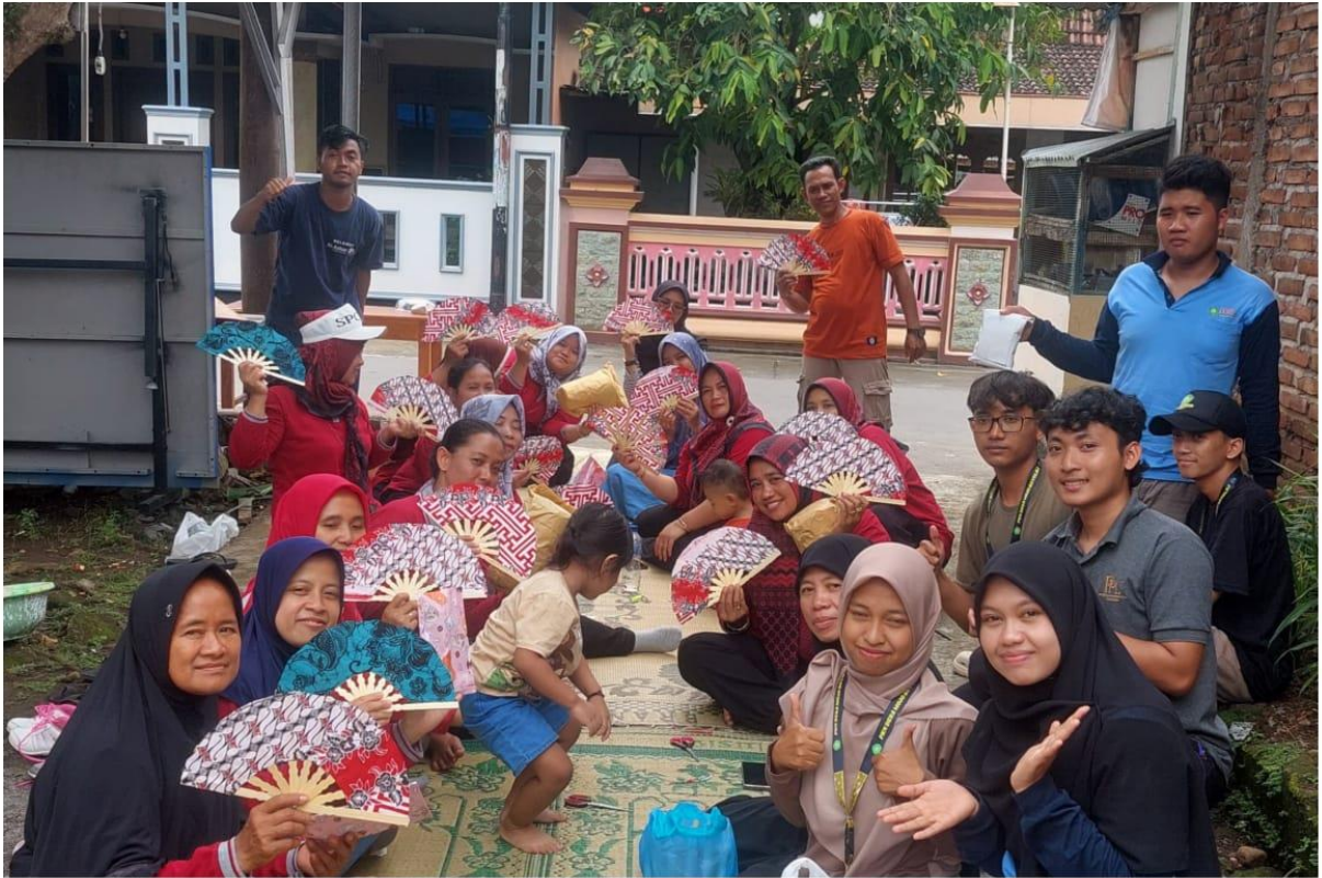
Gambar 2. Proses pelaksanaan pelatihan pembuatan kipas dari bambu

Partisipasi aktif warga menjadi kunci keberhasilan pelatihan ini hal ini sejalan dengan penelitian yang dilakukan oleh Rizal dan tim peneliti (Rizal et al., 2023) yang menyatakan bahwa dibutuhkan partisipasi aktif dari masyarakat dalam setiap pelatihan. Beberapa peserta bahkan mulai menggagas kelompok usaha kecil berbasis kerajinan bambu, seperti tampah dan tumbu. Hal ini peneliti ketahui setelah pelatihan berlangsung