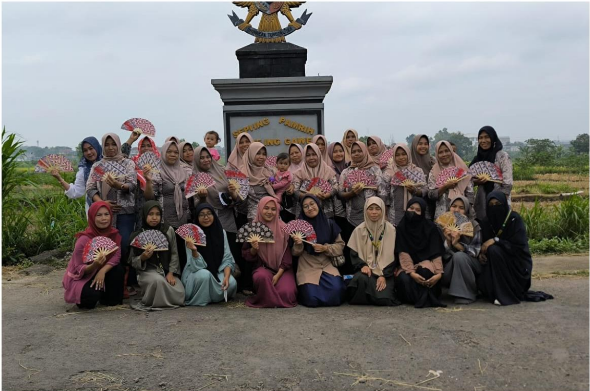
Gambar 3. Antusiasme warga dalam mengikuti pelatihan pembuatan kipas dari bambu bersama mahasiswa PKN Institut Islam Mamba'ul Ulum Surakarta

Selain itu, pelatihan ini membuka peluang kolaborasi antara peserta, mahasiswa pembina, dan pihak desa untuk merintis kelompok usaha bersama sebagai wadah produksi dan pemasaran. Hal ini menunjukkan bahwa pelatihan tidak hanya berfungsi sebagai transfer keterampilan teknis, tetapi juga sebagai pemicu transformasi sosial dan ekonomi di tingkat komunitas. Pada akhir sesi pelatihan, masyarakat juga diajak belajar bagaimana memasarkan produk secara digital melalui facebook , instagram , dan shopee . Pemasaran produk dilakukan secara digital untuk mendukung peningkatan kegiatan penjualan dan memperluas tujuan bisnis UMKM (Safa'atin et al., 2024).