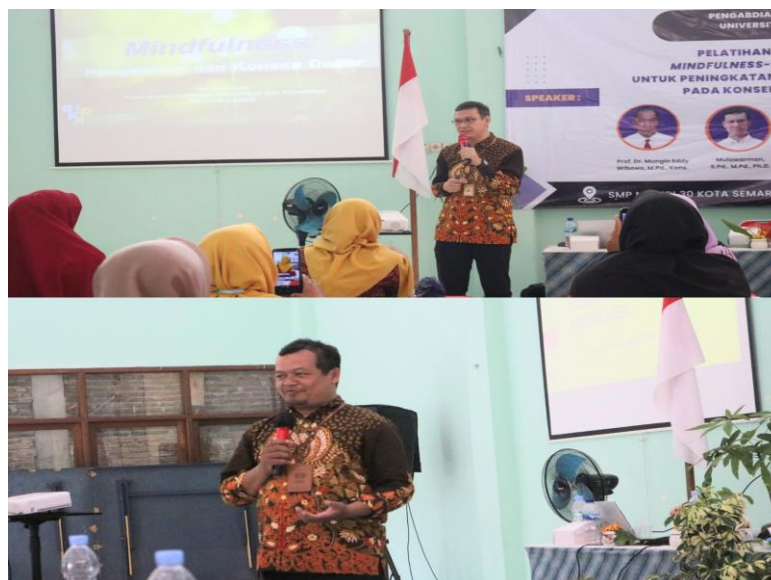
Gambar 2. Pemaparan Materi Mindfulness-based Therapy dan cognitive behavior therapy