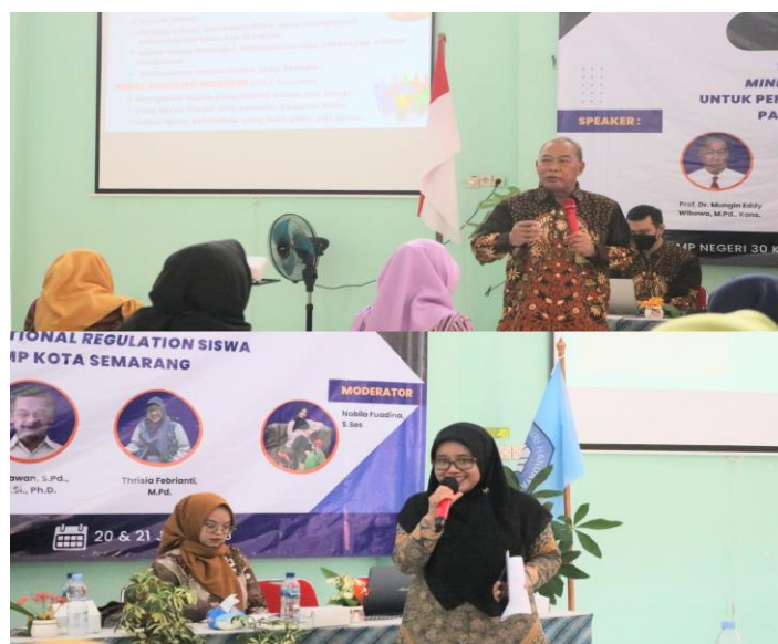
Gambar 1. Pemaparan materi konseling kelompok dan emotion regulation

Metode refleksi adalah aktivitas pelatihan yang berupa penilaian atau umpan balik peserta terhadap pengalaman yang pernah dialami terkait dengan emotion regulation dan konseling kelompok