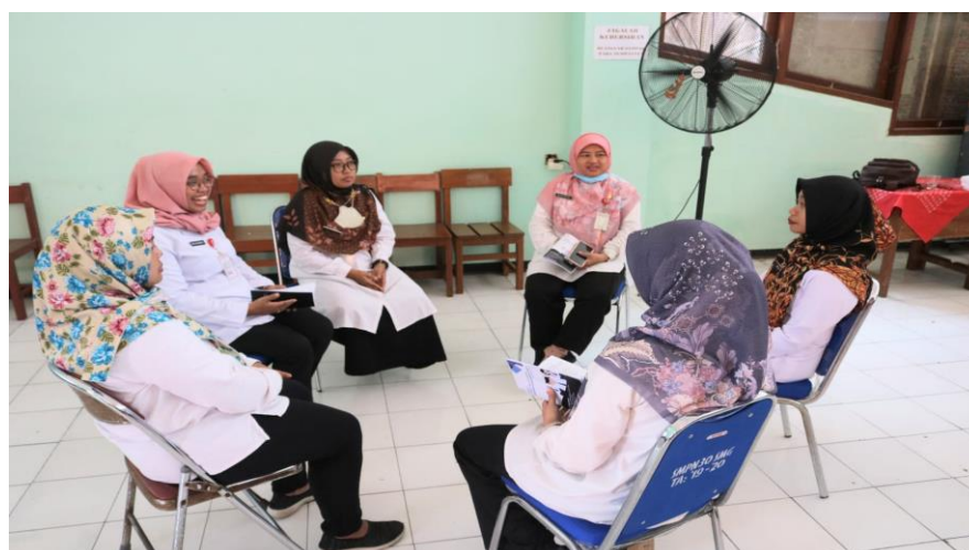
Gambar 3. Praktik konseling kelompok Mindfulness based cognitive therapy

Metode simulasi dan praktik tersupervisi merupakan metode yang memberikan fasilitas kepada peserta, dalam hal ini konselor sekolah dapat mencoba menerapkan secara langsung dari hasil simulasi yang dilakukan, tim pengabdian memberikan supervisi untuk memberikan penguatan dan pengembangan praktik untuk menerapkan konseling kelompok Mindfulness-Based Cognitive Therapy , peserta pelatihan di bagi dalam beberapa kelompok kemudian melakukan simulasi konseling kelompok.