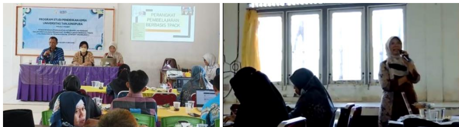
Gambar 3. Pemaparan Materi dan Pendampingan Penyusunan Perangkat Pembelajaran Berbasis TPACK

Kegiatan pendampingan kepada pendidik IPA diawali dengan sosialisasi mengenai pengertian TPACK dan penyusunan perangkat pembelajaran yang terintegrasi dengan TPACK (Gambar 3). Metode dalam penyampaian materi ialah ceramah yang berbantuan powerpoint yang bertujuan untuk memudahkan pendidik serta memberikan gambaran terhadap perangkat pembelajaran yang berbasis TPACK Peserta juga diajak menelaah RPP untuk mengecek implementasi TPACK (Gambar 4).