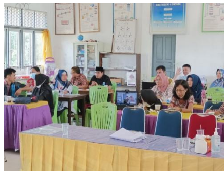
Gambar 2. Peserta Pendampingan Keterampilan Pendidik IPA dalam Penyusunan Perangkat Pembelajaran Berbasis TPACK

Sosialisasi dan pendampingan pendidik mengenai perangkat pembelajaran berbasis TPACK dilaksanakan agar pendidik dapat diberikan gambaran serta dapat meningkatkan pengetahuan mengenai TPACK. Kegiatan dilakukan di Kabupaten Sintang pada tanggal 23 Juli 2022 secara luring dilaksanakan oleh PS Pendidikan Kimia yang diikuti oleh pendidik IPA sebanyak 18 orang (Gambar 2). Sosialisasi dan pendampingan disampaikan oleh dosen PS Pendidikan Kimia yang bertujuan untuk memberikan pengetahuan kepada pendidik tentang penggunaan TPACK sebagai tantangan pembelajaran abad 21.