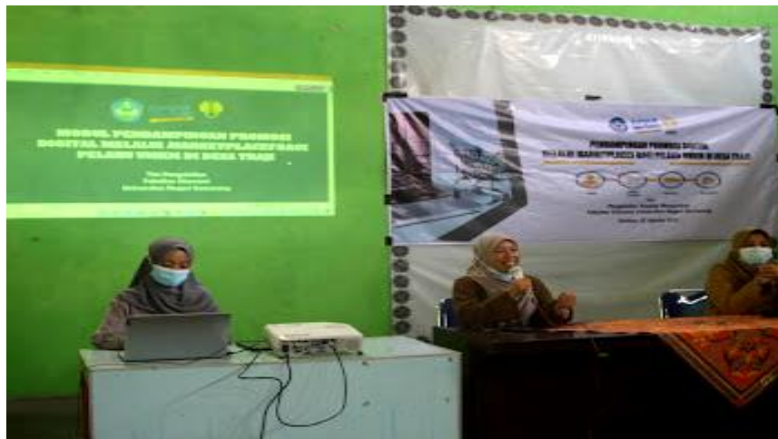
Gambar 2. Pemaparan dan demonstrasi pembuatan Akun Shopee