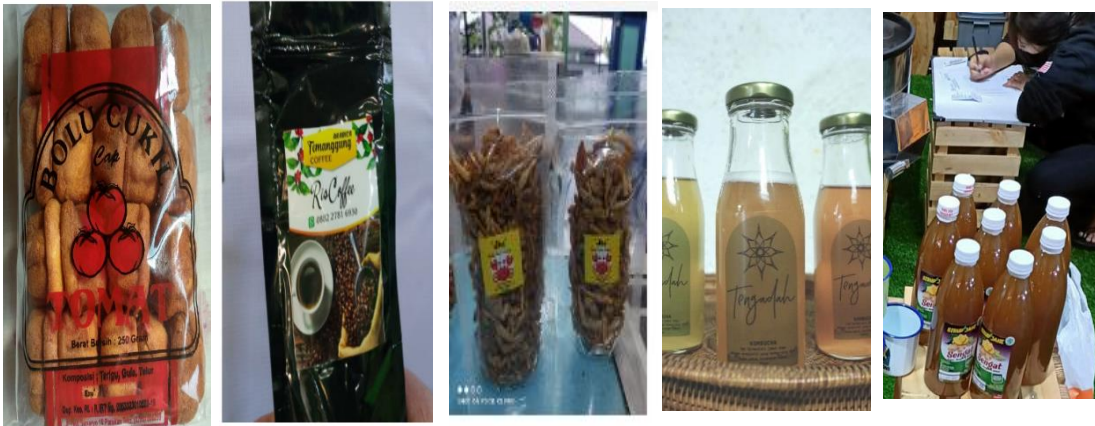
Gambar 1. Produk UMKM yang akan di pasarkan melalui Akun Shopee