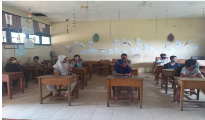
Gambar 1. Siswa Mengikuti Kegiatan Sosialisasi

Adapun langkah-langkah kegiatan sosialisasi adalah sebagai berikut: