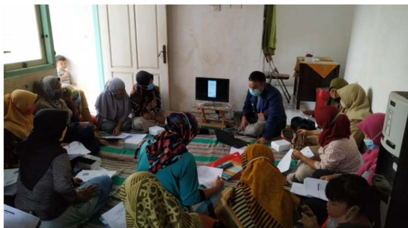
Gambar 5. Kegiatan Pendampingan Lanjut

Adapun langkah-langkah dalam penggunaan fitur Google Family link adalah sebagai berikut: Pada masing-masing perangkat ponsel, unduh aplikasi Google Family Link di App Store untuk perangkat iOS atau Google Playstore pada perangkat Android. Pada perangkat milik orang tua,