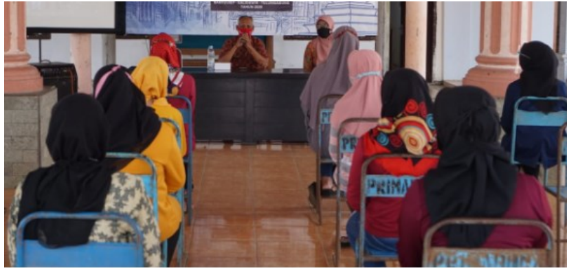
Gambar 3. Pembukaan Kegiatan