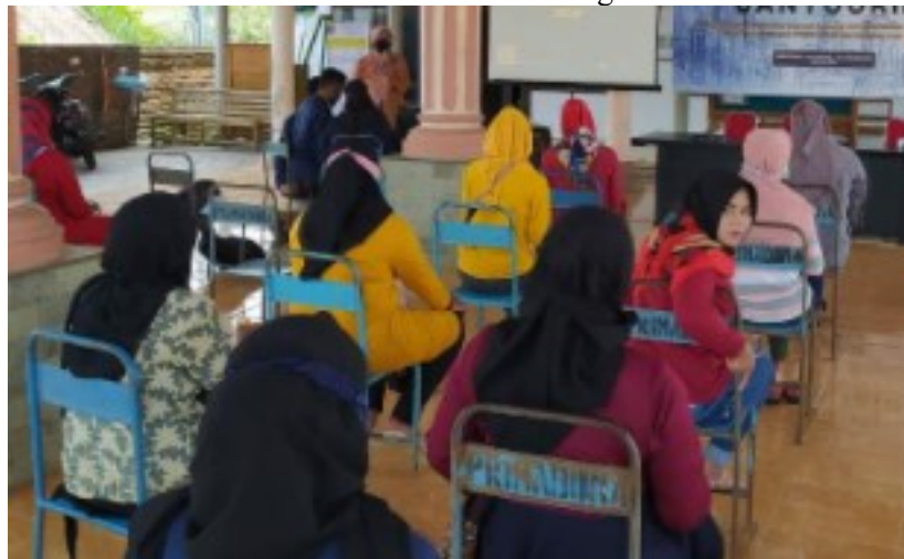
Gambar 4. Sosialisasi kegiatan pertama