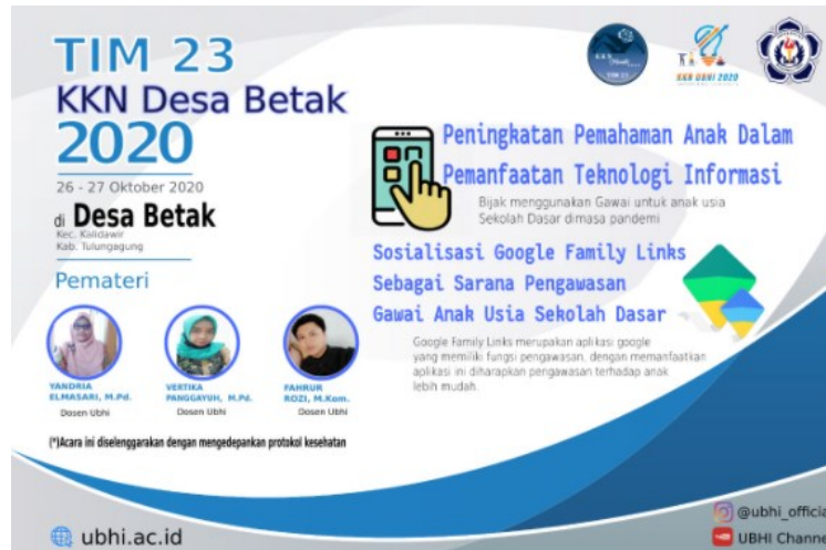
Gambar 2. Flyer Kegiatan