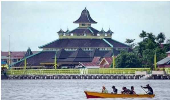
Gambar 2 Masjid sebagai bangunan pertama yang didirikan di Kesultanan Pontianak

a Creative Commons Attribution-NonCommercial 4.0 International License