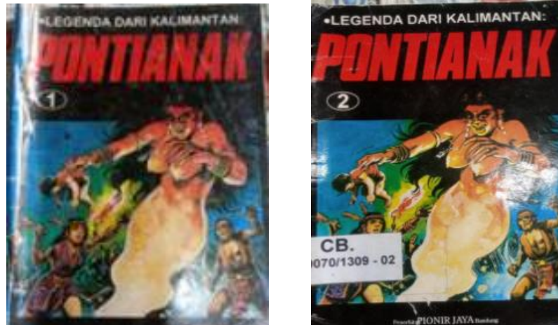
Gambar 1.1 Buku Legenda dari Kalimantan: Pontianak Jilid 1 dan 2 terbitan Pionir Jaya Bandung

a Creative Commons Attribution-NonCommercial 4.0 International License