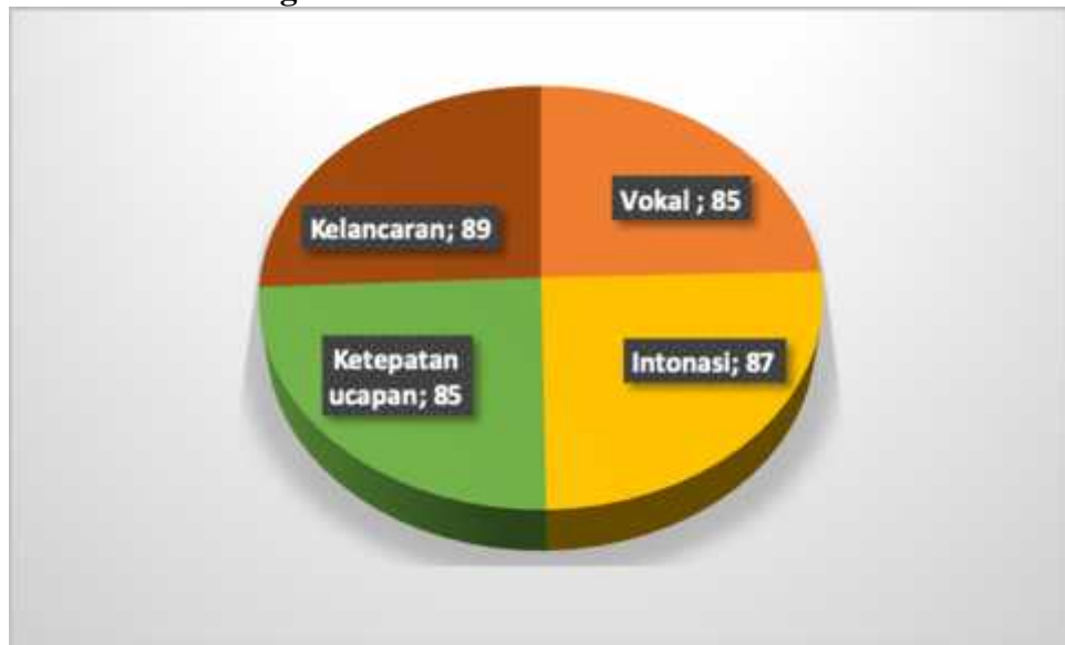
Diagram 2. Hasil Rata-Rata Nilai Kelas B

Terlihat pada diagram 2 digambarkan bahwa rata-rata nilai kelas B dilihat berdasarkan dari aspek vokal, intonasi, ketepatan ucapan, serta kelancaran sudah ada pada kategori baik, artinya mahasiswa sangat memperhatikan aspek-aspek yang perlu diperhatikan dalam keterampilan berbicara. Dari 12 video pada kelas B ini, rata-rata pada aspek vocal mendapatkannilai 85, pengucapan serta pelafalan vokal terdengar jelas, sehingga penonton dapat dengan jelas memahami informasi yang disampaikan oleh mahasiswa.