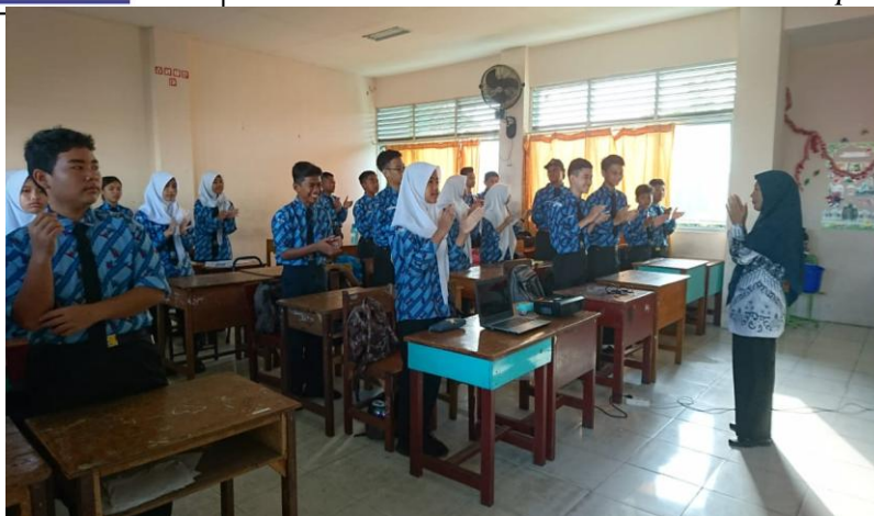
Gambar 1. Kegiatan Pembelajaran Menulis Teks Berita